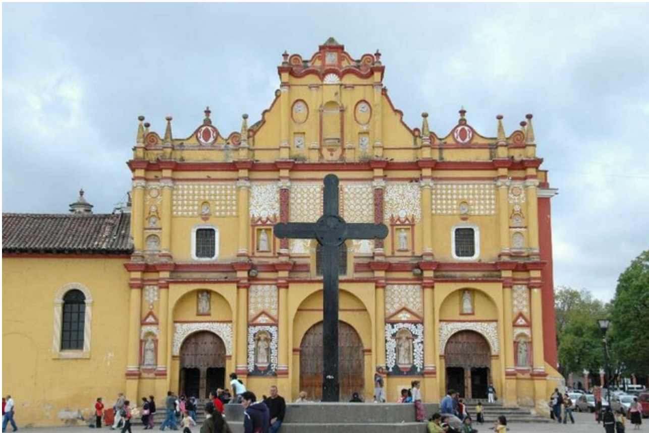
Kathedrale von San Cristobal