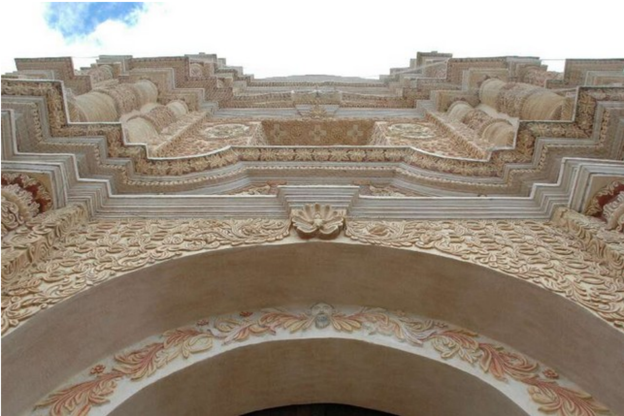
Fassade Santo Domingo