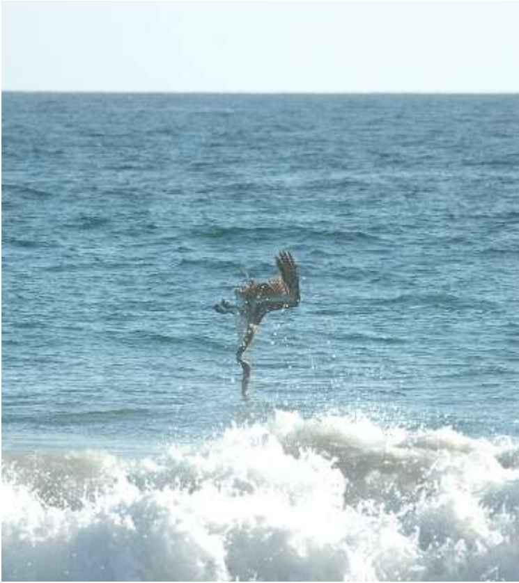
fischender Pelikan im Sturzflug