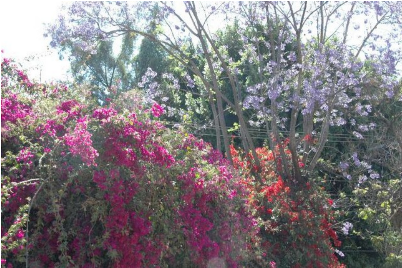
Blütenpracht in Oaxaca