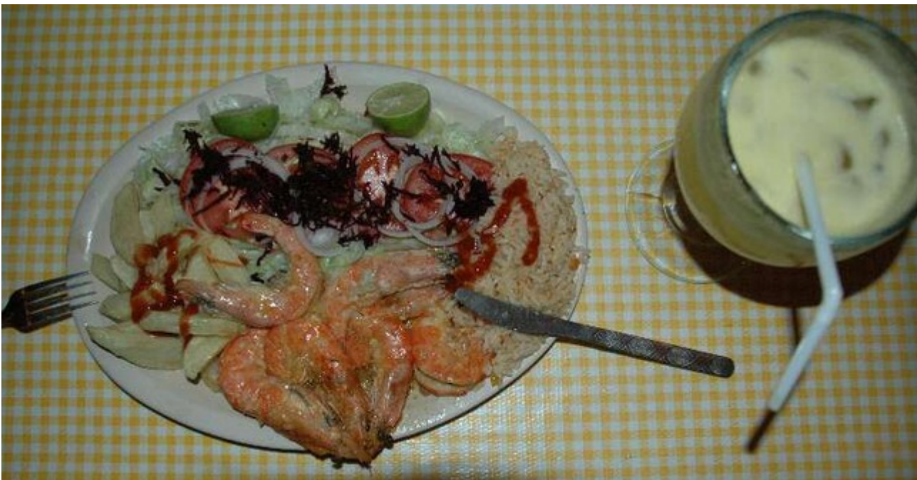
Gourmetessen für zweieinhalb Euro