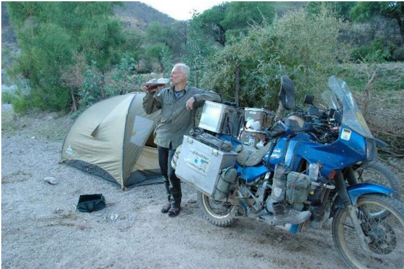
Übernachtung am Fluss

Gute Idee, wir fuhren weiter und fanden nach einigem Suchen ein schön abgelegenes Plätzchen am flachen Wasser, dem Überbleibsel eines breiten Flusses. Ein freundlicher Bauer, der dort auf seinem Acker arbeitete, bestätigte uns, dass wir dort ruhig zelten könnten und so taten wir`s. Kein Verkehrslärm, sondern quakende Frösche und zirpende Grillen, keine quasselnden Menschen, sondern das leise Plätschern des Wassers, wir atmeten auf, kochten uns ein paar Kartoffeln mit Zwiebel-Maisgemüse und schliefen dann fest die ganze Nacht durch.