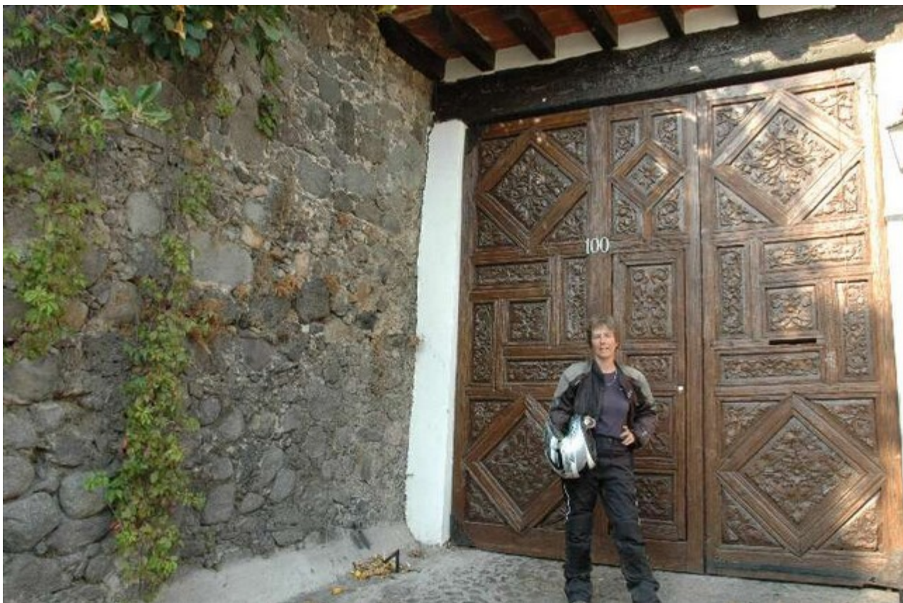
verschlossene Tür in Cuernavaca