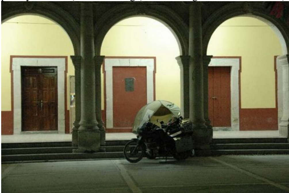
Zelten auf der Plaza

Ich fand es toll, was diese beiden einfachen Frauen hier in Eigeninitiative auf die Beine stellen. Sie gaben mir zum Abschied ihre handgemalte Visitenkarte mit Mailadresse ( artedetejupan@yahoo.com ) und Fotoblog ( www.fotolog.com/casadecultura/ ).