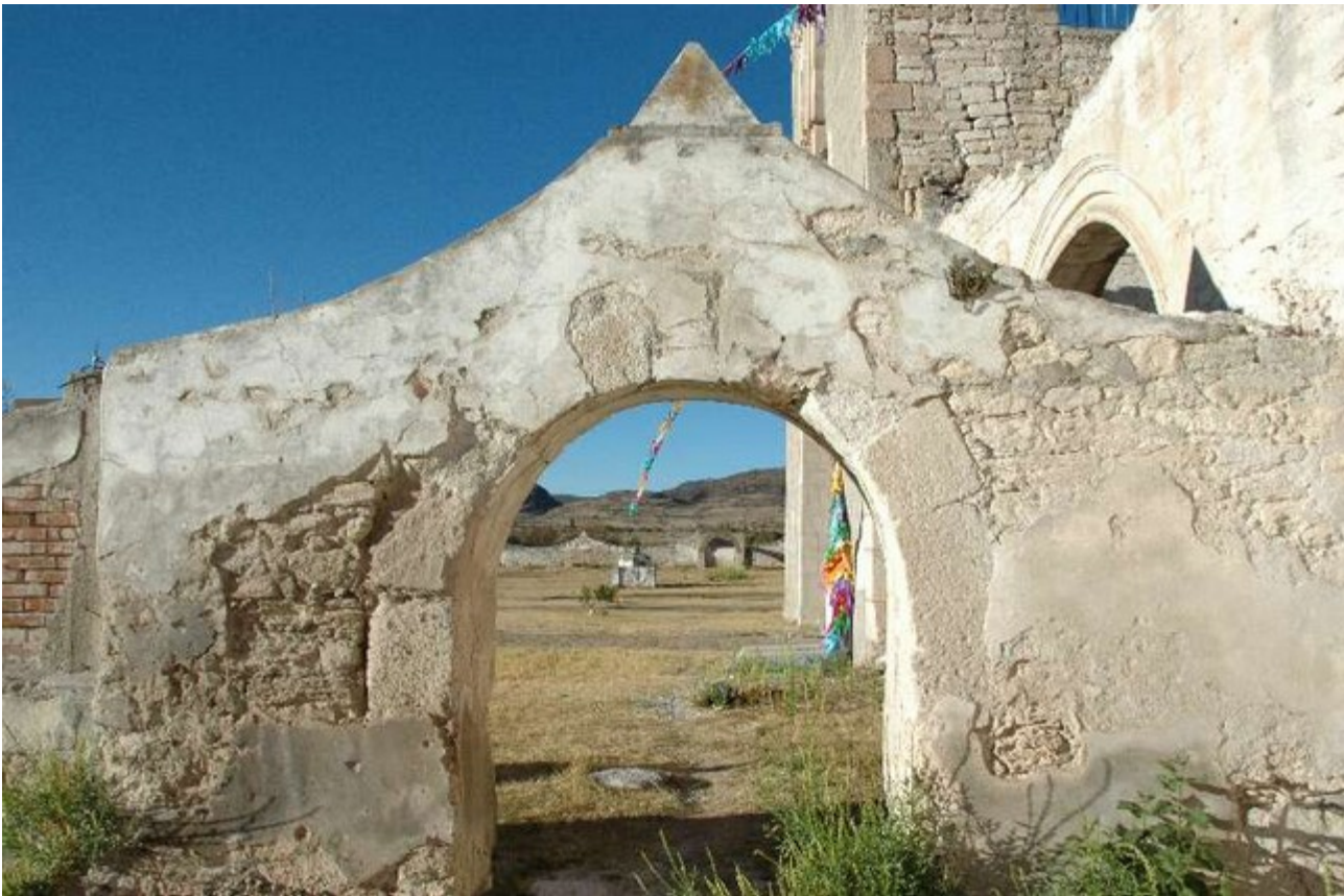
Tejupan, mexikanischer gehts nicht!