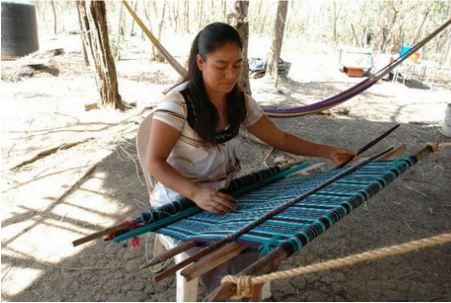
Weberin am Aguacero