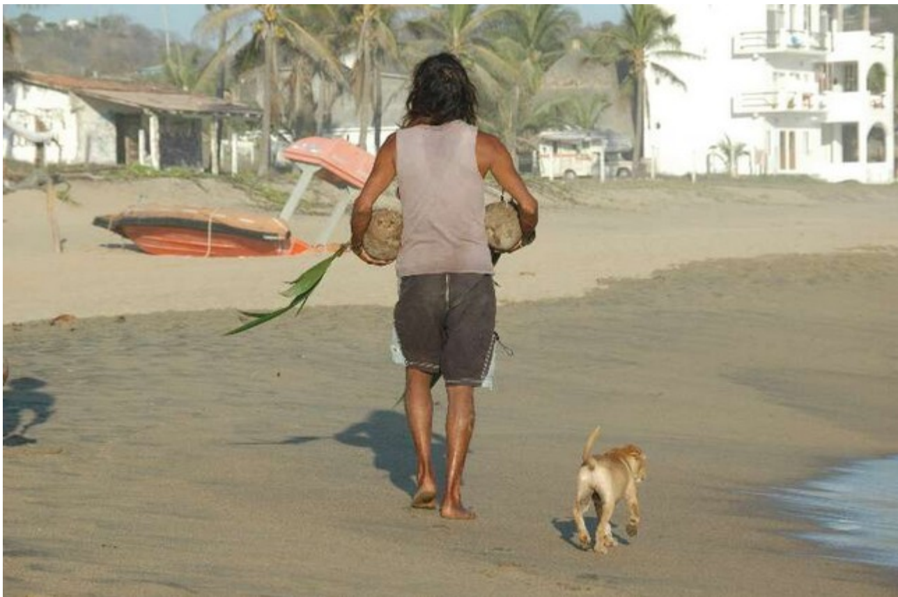
Strandleben in Zipolite