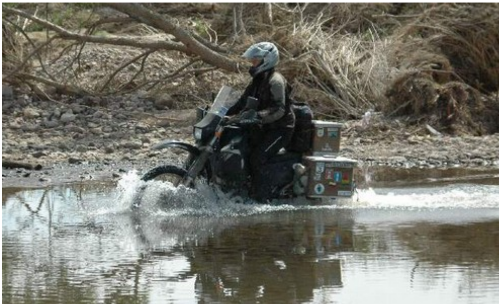
durch den Fluss