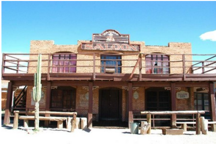
Villa del Oeste - Westerndorf...