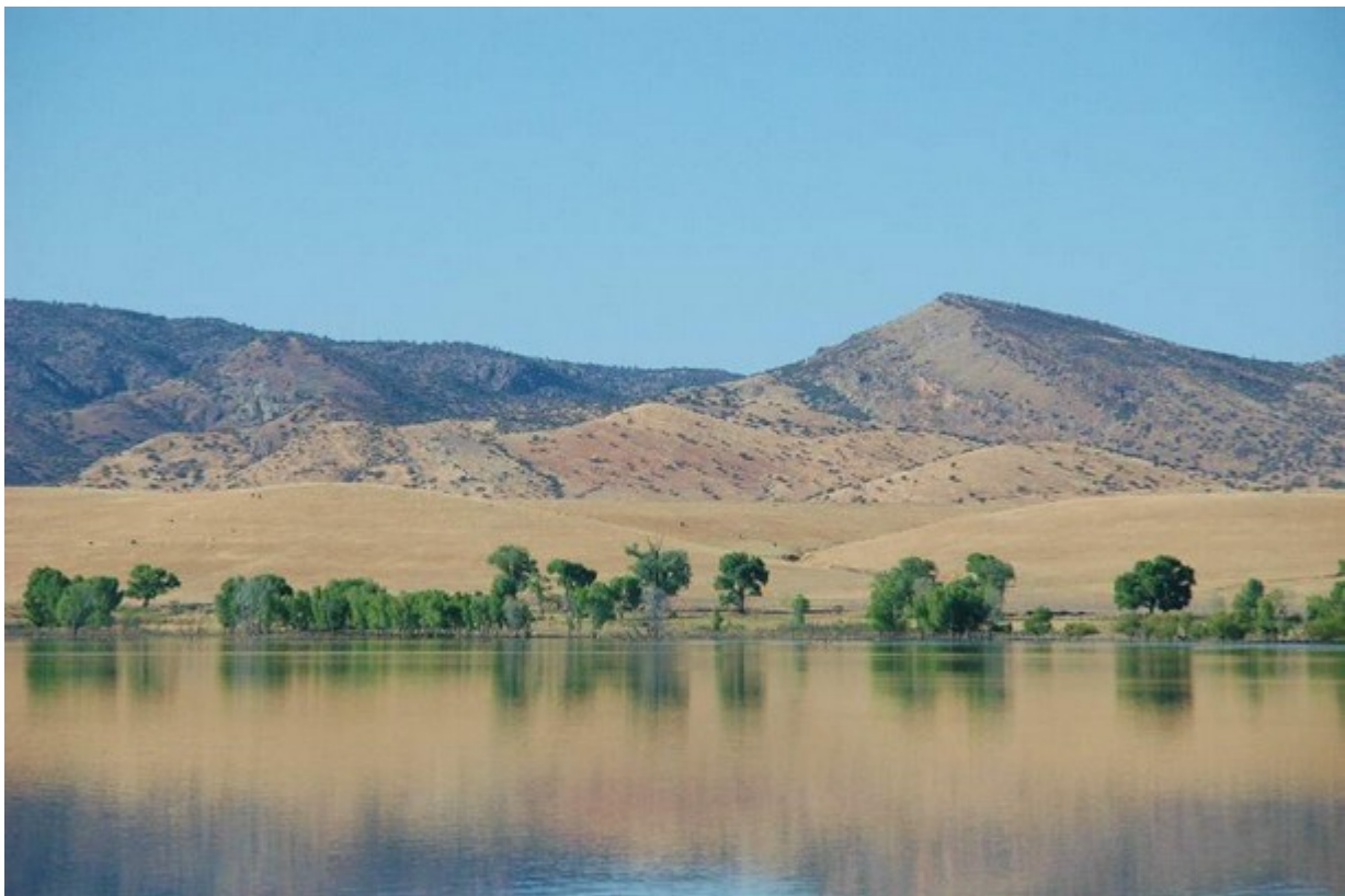
stiller See bei Rosario

Fr.03.04. irgendwo in den Bergen zwischen Balleza und Guachochi