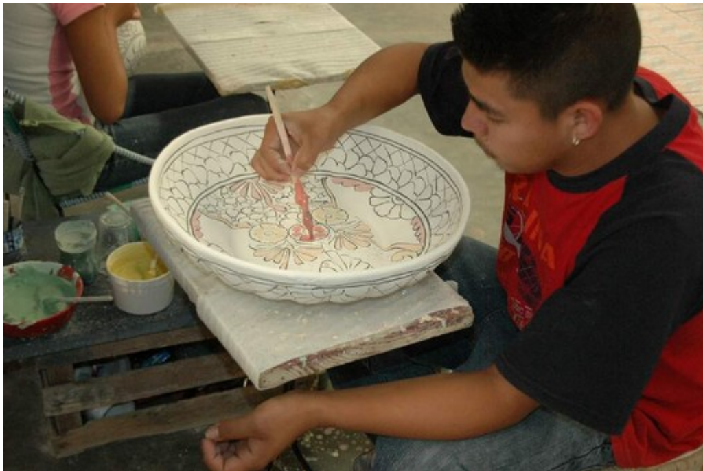
..und ihre Herstellung

Gegenüber der Keramikwerkstatt lag ein Restaurant, auch nicht schlecht, denn wir hatten Hunger! Mit gefülltem Magen fuhren wir noch eine gute Stunde, bis wir hier ankamen. Nun sitze ich im offenen Zelt, auf der gegenüberliegenden Seite des Sees spielen ein paar Jungs in der Abendsonne Fußball. Es ist still, außer dem ruhiger werdenden Wind und dem Bolzen der Fußballer ist kaum ein Geräusch zu hören. Das können wir gut haben, denn die letzten Nächte nahe der vielbefahrenen Straßen waren doch ziemlich unruhig. Ich weiß nicht, warum das so ist, aber die großen Trucks machen einen Höllenlärm, wenn sie mit Motorbremse bergab fahren. Das weckt sicher sogar Tote auf! Schauen wir mal, ob wir hier ruhiger schlafen können.