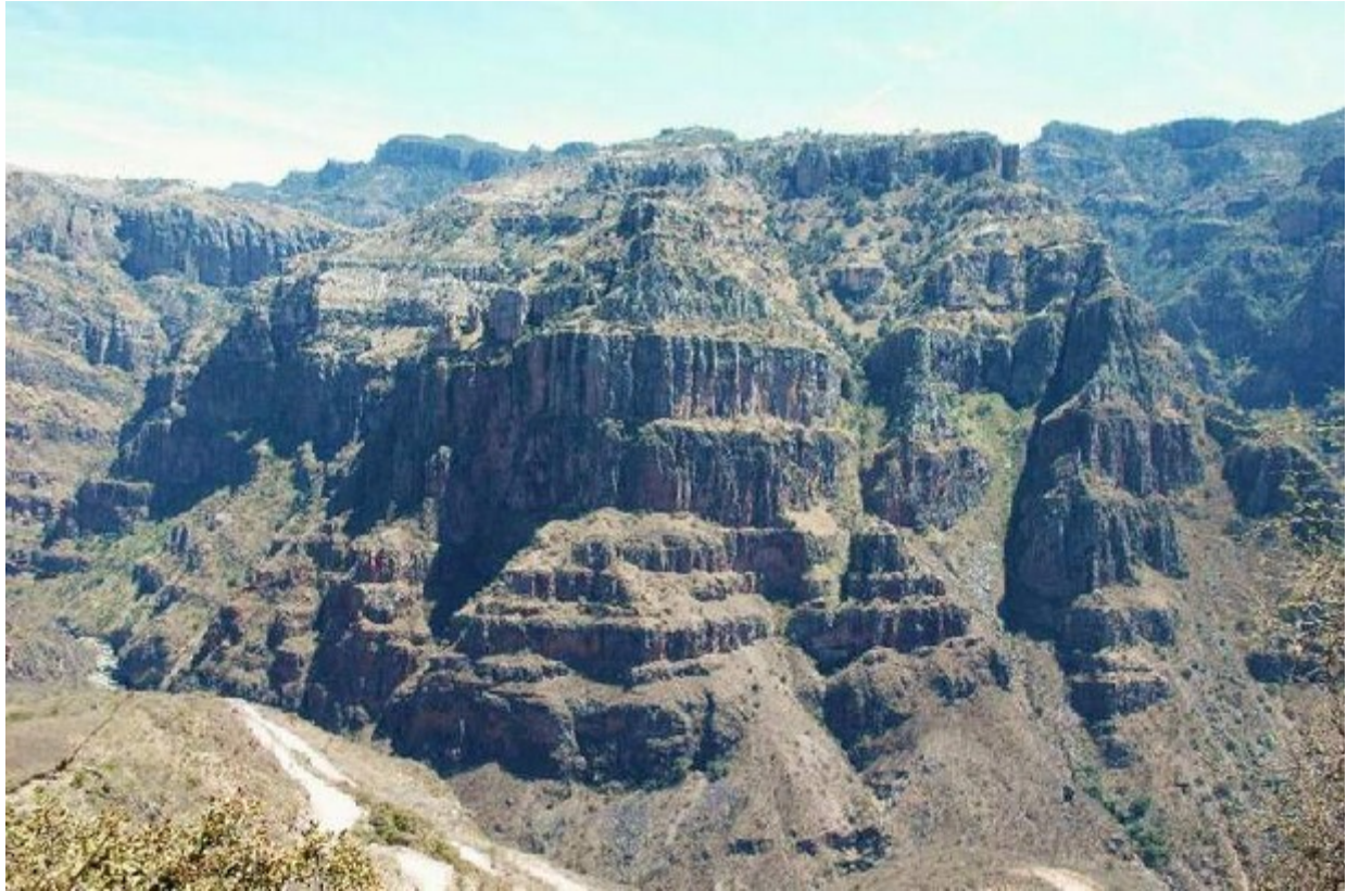
die Schlucht von Batopilas