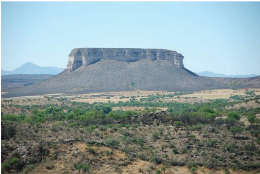
...und die richtige Landschaft dazu

Das nächste Etappenziel heißt Hidalgo del Parral und ist von Durango ca 370km entfernt. Ganz schön groß, dieses Mexiko! Nach fünf Tagen unterwegs sind wir nun über 1100km von Cuernavaca entfernt und haben trotzdem erst ungefähr die halbe Strecke bis zur Grenze der USA hinter uns. Von Parral aus wollen wir eine kleine Straße zur Barranca del Cobre, dem Kupfercanyon, einer besonders schönen und fast 2000m tiefen Schlucht, suchen. Alle schwärmen von dieser Schlucht, also schauen wir uns dort auch mal um. Laut Reiseführer wird das mal wieder ein abenteuerliches Offroad-Erlebnis, wir sind gespannt.