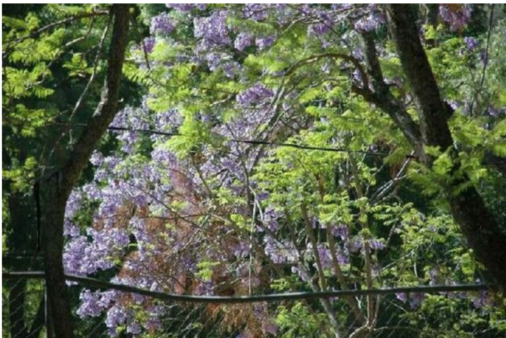
frühlingshafte Blüten am Jacarandabaum

Egal, wir haben jedenfalls einen Tisch, an dem wir sitzen können und eine Dusche gibt es auch.