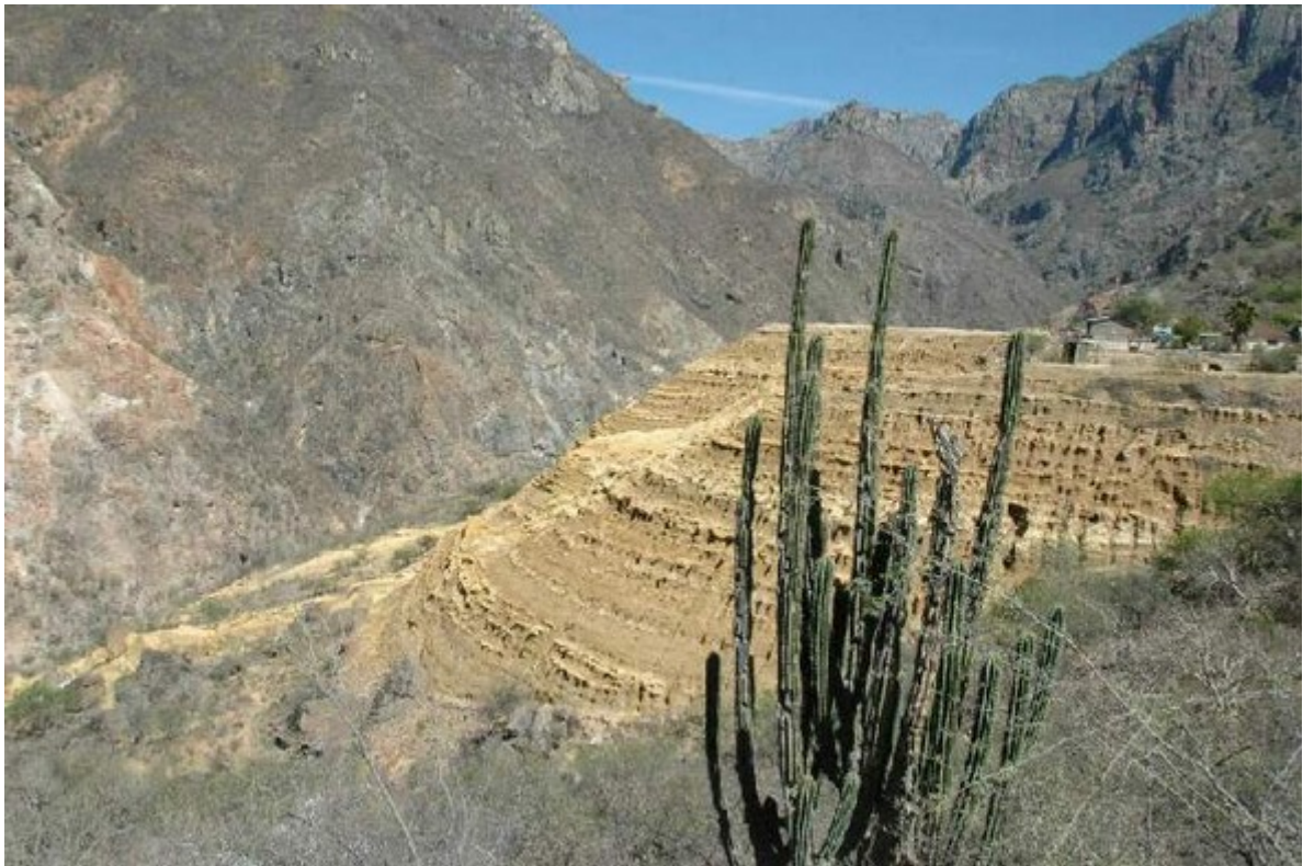
auf halbem Weg nach Batopilas